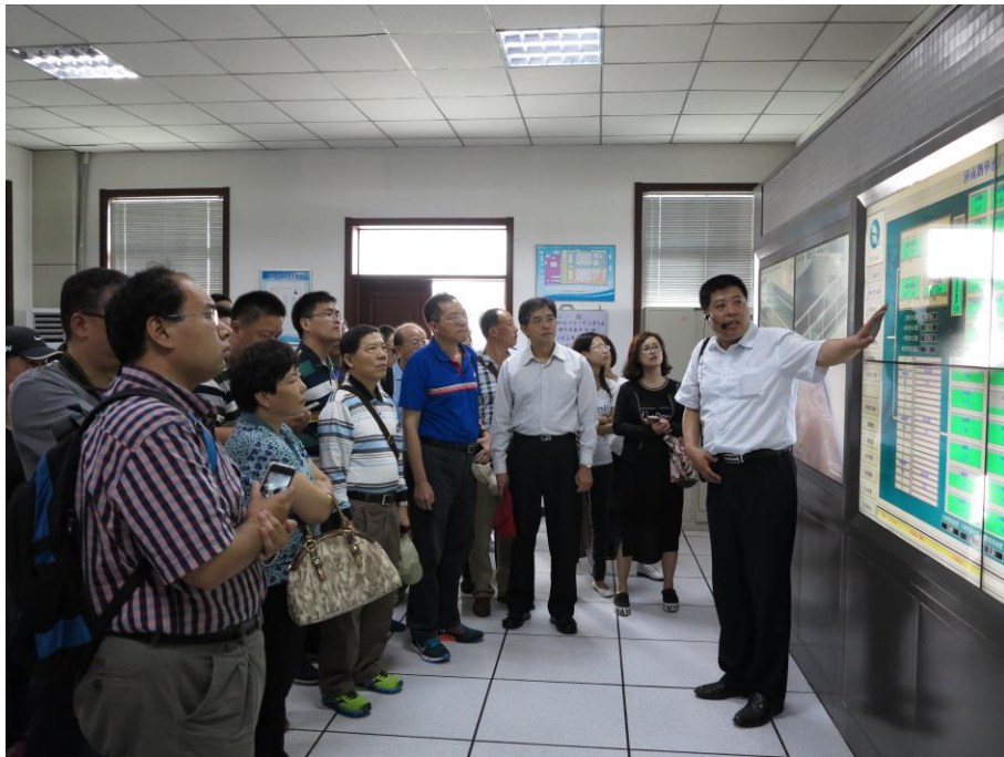
鵲華水廠改造示範工程解說