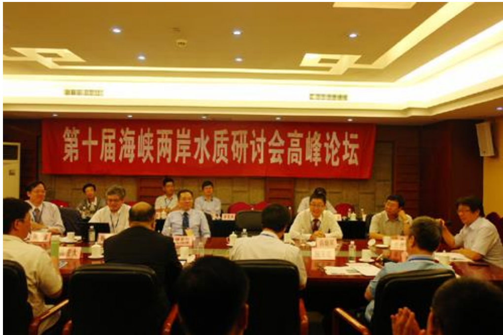
高峰論壇 (水質安全保障技術與管理—濟南問道)