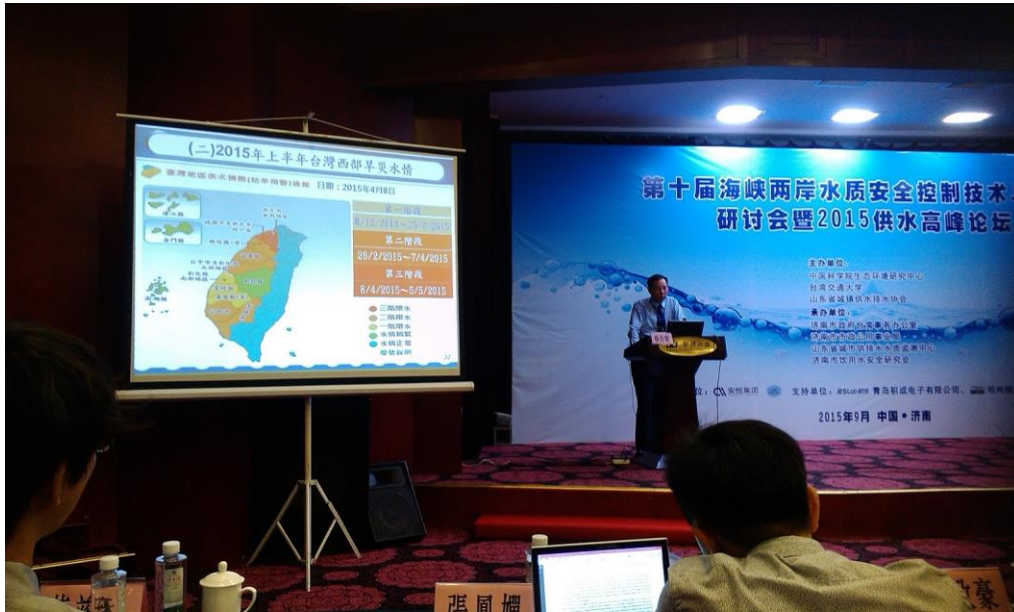
應邀於大會進行特邀報告-- (氣候變遷下自來水事業面臨的挑戰)